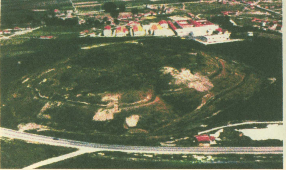
Dorylaion Kalesi'nin bulunduğu Şarhöyük kazılarında bir görünüş

Myriokephalon'da uğradığı büyük yenilgi imparator Manuel'in bütün plânlarını suya düşürdüğü gibi, Bizans'ın askerî gücüne de büyük darbe indirdi. Yapılan barış anlaşmasının şartlarına göre sultan Dorylaion ve Sublaion (Menderes kaynakları yakınında) kalelerinin yıktırılması hususunda ısrar etmişse de, Manuel sadece Sublaion kalesini yıktırmakla yetinmiştir. Bunun üzerine sultan II.Kılıç Arslan uzun süre imparatorun anlaşmaya sadık kalması ve Dorylaion kalesini de yıktırması 37 hususunda isteğini tekrarlamış, fakat bir sonuç elde edemeyince Bizans'a karşı Menderes Vadisi boyunca sahile kadar uzayan bir cezalandırma seferi düzenlemiştir 38 . Büyük bir ihtimalle sultan, 1180 tarihinde Kütahya'nın tahrip edilmesiyle ilgili olarak yapılan sefer sırasında veya biraz sonra Dorylaion'u da kesin olarak geri almış ve bundan sonra Bizans hâkimiyetinden çıkan Dorylaion bir Türk yurdu haline gelmiştir.